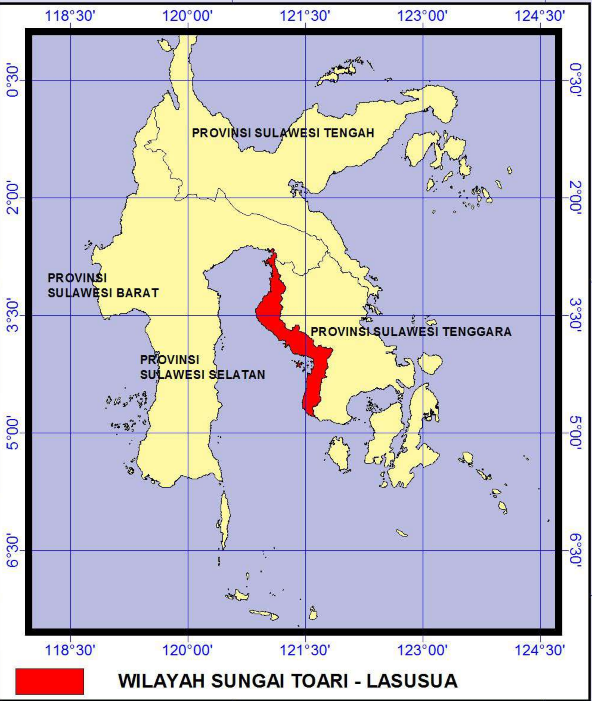
WILAYAH SUNGAI TOARI - LASUSUA